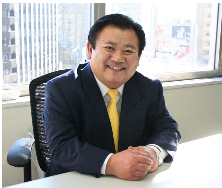
株式会社喜代村 代表取締役社長