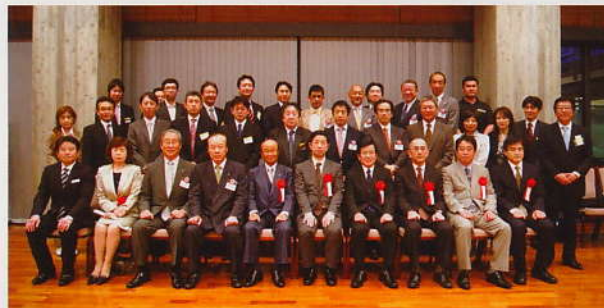
平成23年度 第39回定時通常総会 国際文化会館