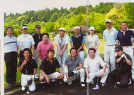
社会貢献・交流 税の普及・啓蒙、地域イベントへの参加、ボランティア等様々な活動を通して社会への貢献と交流を行っています。