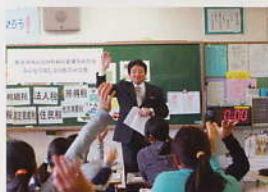
租税教育 麻布税務署管内の小・中学校を対象に、授業の一環として「租税教室」を開催しています。