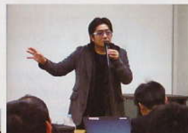
研究会・勉強会 税知識の習得をはじめ政治・経済・社会他あらゆる時事問題についての勉強会を開催しています。