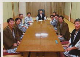
ネットワーク 全国442ヶ所の法人会青年部は、公益事業と様々な会合を通して交流し連携を図っています。