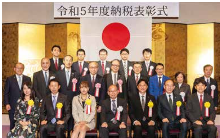
令和5年度 納税表彰式 麻布税務署長感謝状受表彰記念