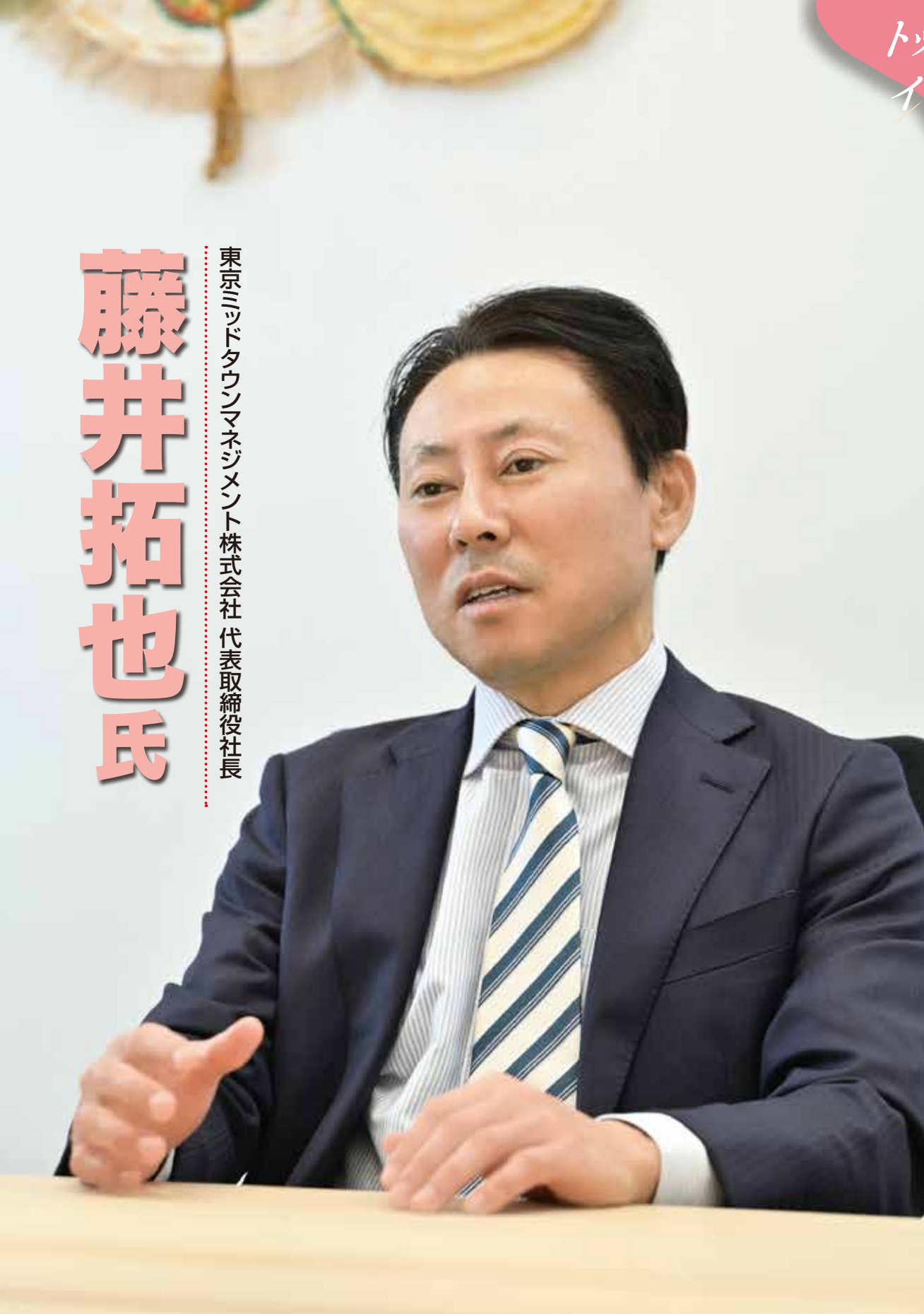
東京ミッドタウンマネジメント株式会社代表取締役社長