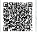
主税局ホームページ