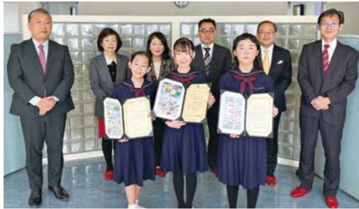
サンエー・クラブが行っている「租税教室」のお話に大変興味深く耳を傾けていただきました。部長先生の租税教育に対する意欲を感じ、引き続き「税に関する絵はがきコンクール」にご協力頂くようお願いをいたしました。

令和4年度の「税に関する絵はがきコンクール」は、麻布管内9校742名の参加をいただきました。絵の専門家を加えた役員と麻布税務署幹部をはじめ、港区税務事務所所長、港区役所税務課、港区教育委員会の方々に厳正な審査をいただいた結果、「麻布税務署署長賞」、「港区教育委員会賞」、「優秀賞」の3賞を東洋英和女学院小学部の児童さんが受賞され、1月12日に麻布法人会、麻布税務署、東洋英和女学院小学部の関係者で同学院にて授賞式を行いました。児童さん達の嬉しそうな顔がとても印象的でした。おめでとございます。